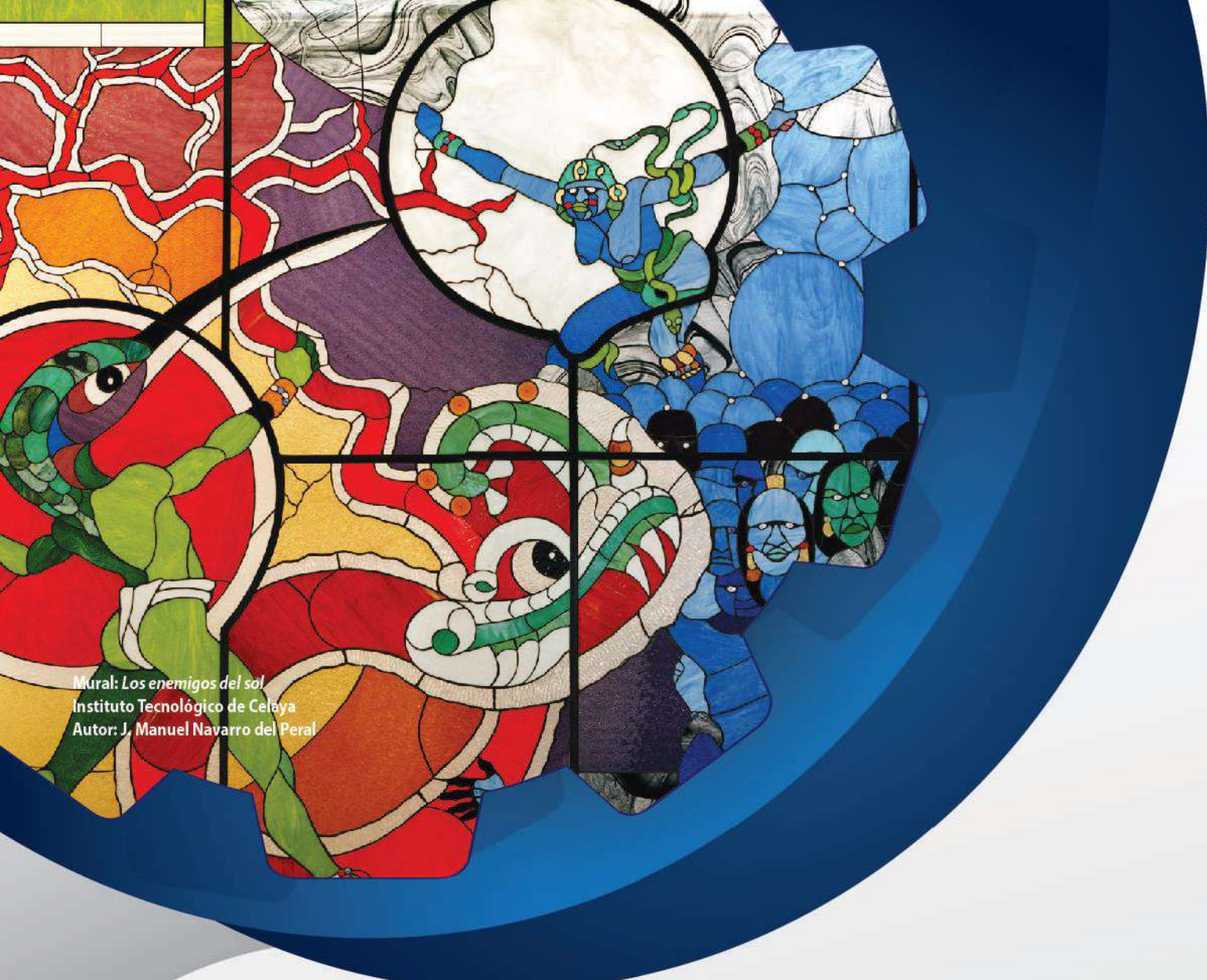
Mural: Los enemigos del sol Instituto Tecnológico de Celaya Autor: J. Manuel Navarro del Peral