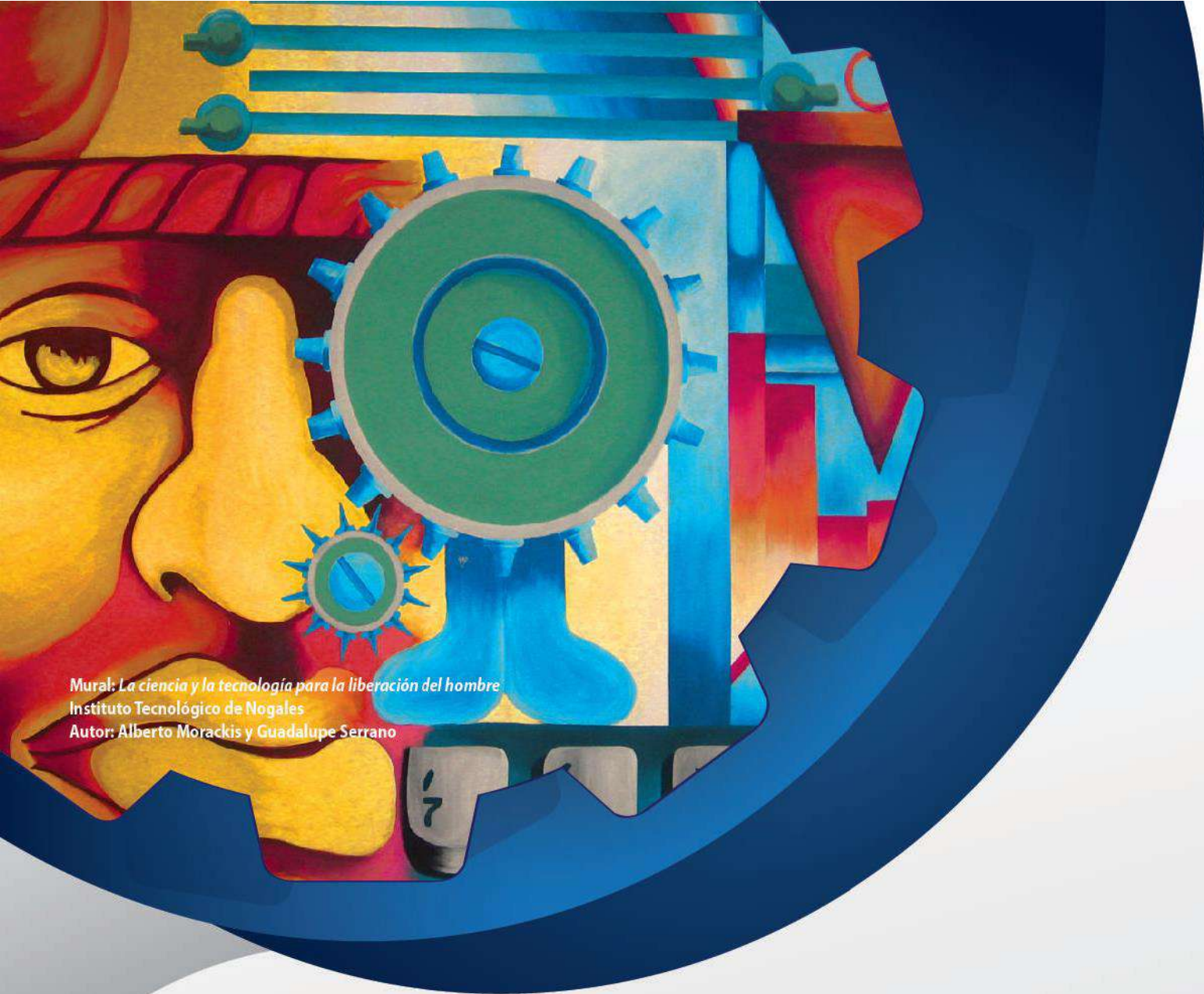
Mural: La ciencia y la tecnología para la liberación del hombre Instituto Tecnológico de Nogales Autor: Alberto Morackis y Guadalupe Serrano