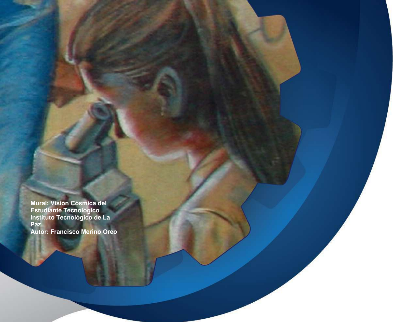
Mural: Visión Cósmica del Estudiante Tecnológico Instituto Tecnológico de La Paz Autor: Francisco Merino Oreo