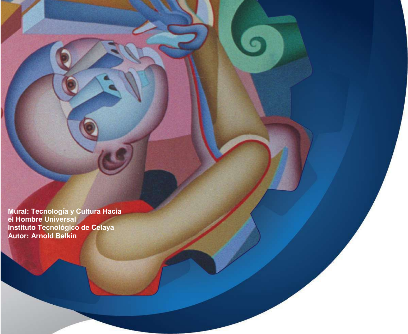
Mural: Tecnología y Cultura Hacia el Hombre Universal Instituto Tecnológico de Celaya Autor: Arnold Belkin