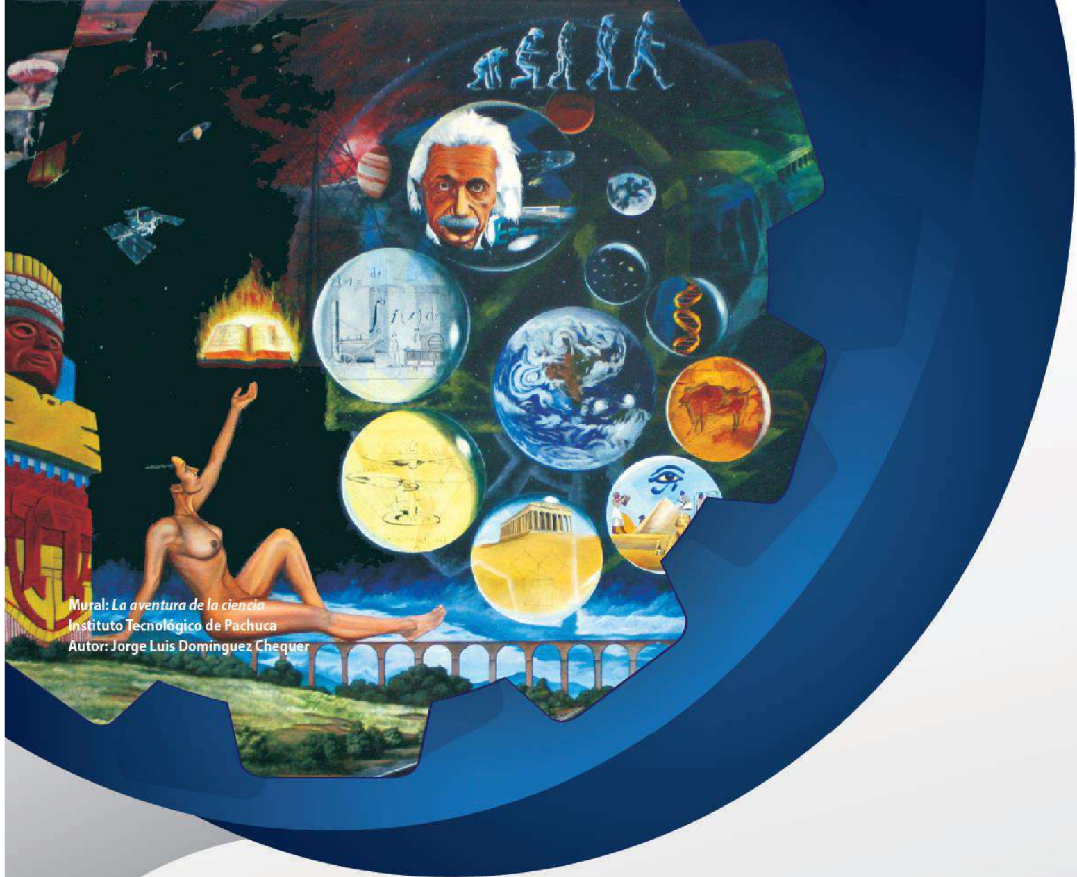
Mural: La aventura de la ciencia Instituto Tecnológico de Pachuca Autor: Jorge Luis Domínguez Chequer