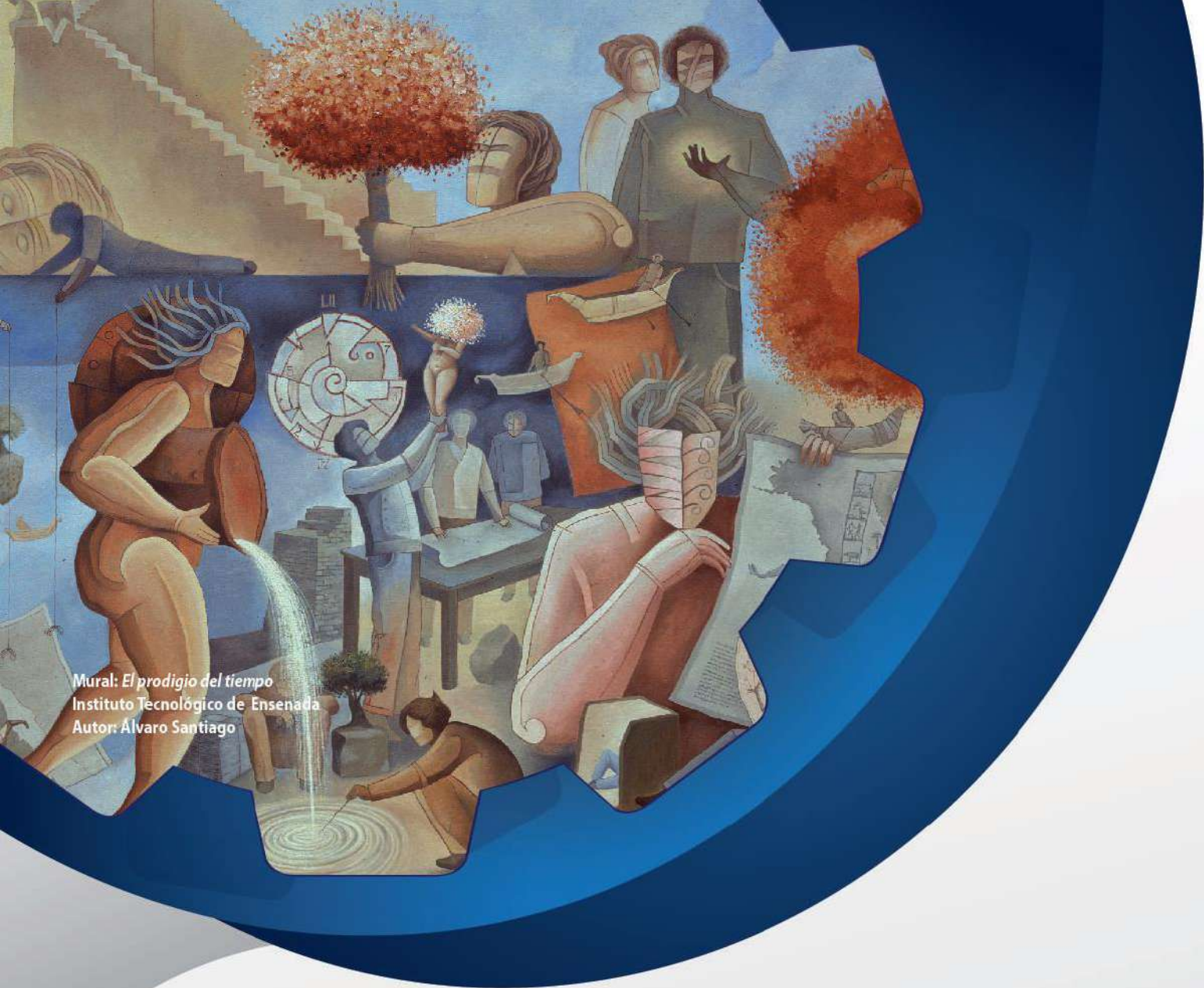
Mural: El prodigio del tiempo Instituto Tecnológico de Ensenada Autor: Alvaro Santiago