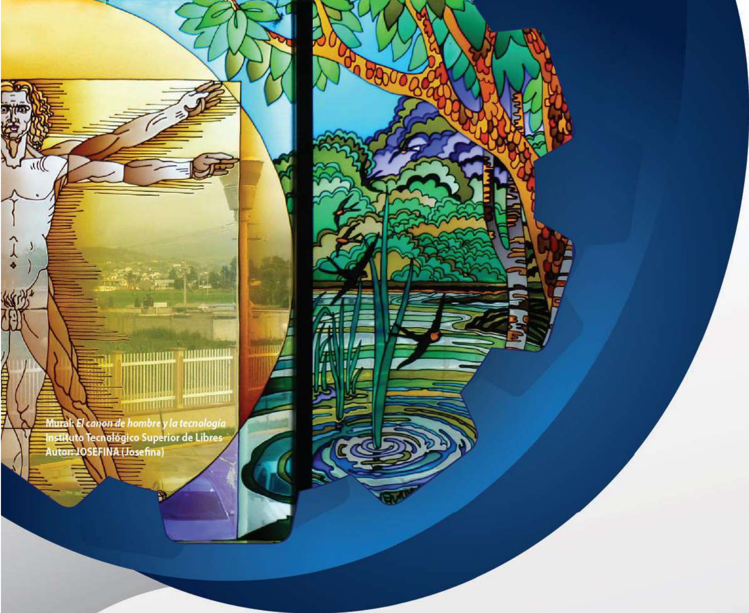
Mural: El cañon de hombre y la tecnología Instituto Tecnológico Superior de Libres Autor: JOSEFINA (Josefina)